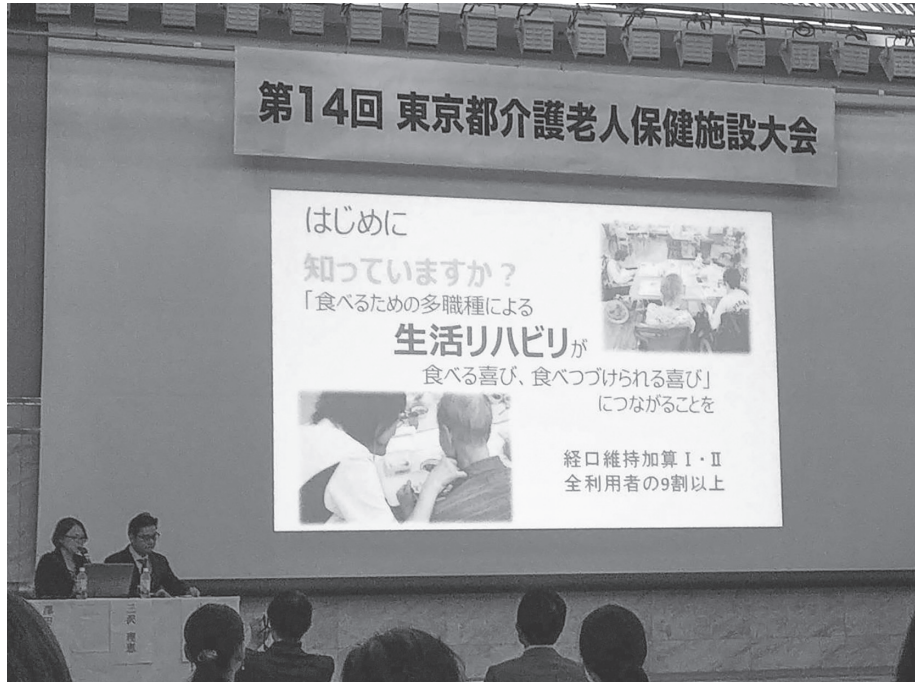
多職種協働で行う生活リハビリについて 発表したときの様子

これは、生活リハビリが行える環境づくりに加え、制度改正のたびに、それに応じた体制づくりを各部署の幹部が協働して行った結果です。実際に動いているときは必死過ぎて思いつきませんでした。それぞれの利用者の方に求められる直接的な支援をするための体制づくりに向けて、間接的に幹部が多職種協働をしていたのだと、今回原稿を書きながら、改めて感じました。